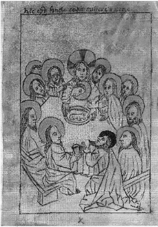
Laatste avondmaal, in: 'Vita salvatoris'. Duitsland, ca 1500. Nijmegen: UB, Hs. 149, pl. (!) 10r. Afgebeeld in HUISMAN.

Het BOEK behouden. Leiden: Nederlandse Boekhistorische Vereniging, 1997. (= Jaarboek voor Nederlandse Boekgeschiedenis, 4). 337 pp., ill. (deels kleur). ISBN 9 0751 3304 9. f 60.