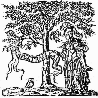
Drukkersmerk van het huis Elzevier